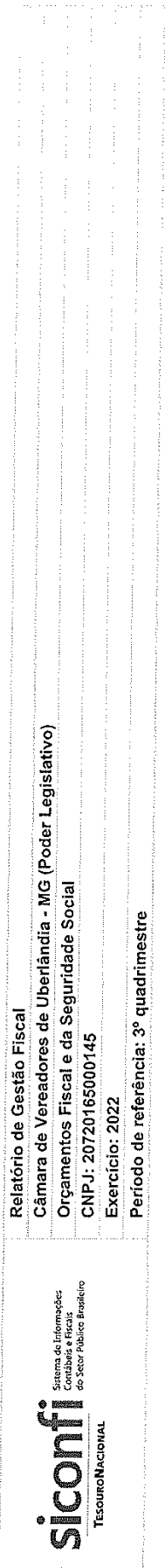
RGF-Anexo 01 | Tabela 1.2 - Trajetória de Retorno ao Limite da Despesa Total com Pessoal